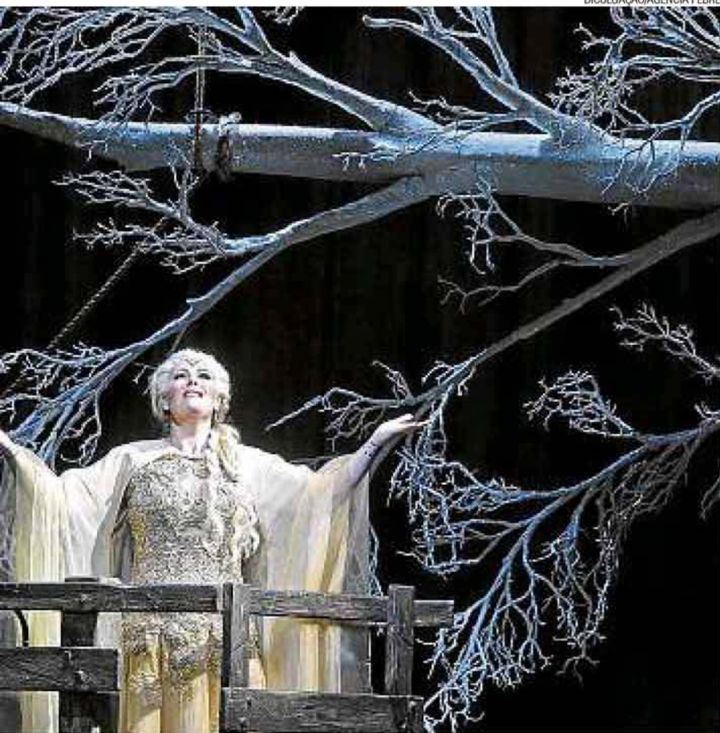
No telão. "Norma", de Bellini, será exibida na terça-feira

ponsável pelo treinamento de grandes nomes da ópera, como Natalie Dessay ou Rolando Villazon. O festival terá também encontros culturais e ação educativa, com material didático da Rede Sesc Nacional.